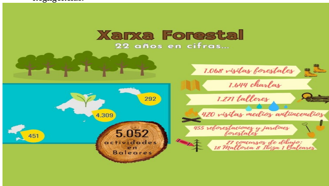
Figura 3. Varias cifras de las actividades de los 22 años de existencia de Xarxa Forestal