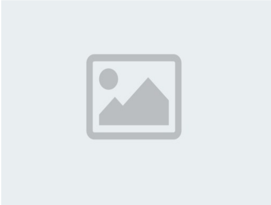
Figura 1. Algunos de los materiales producidos por Xarxa Forestal